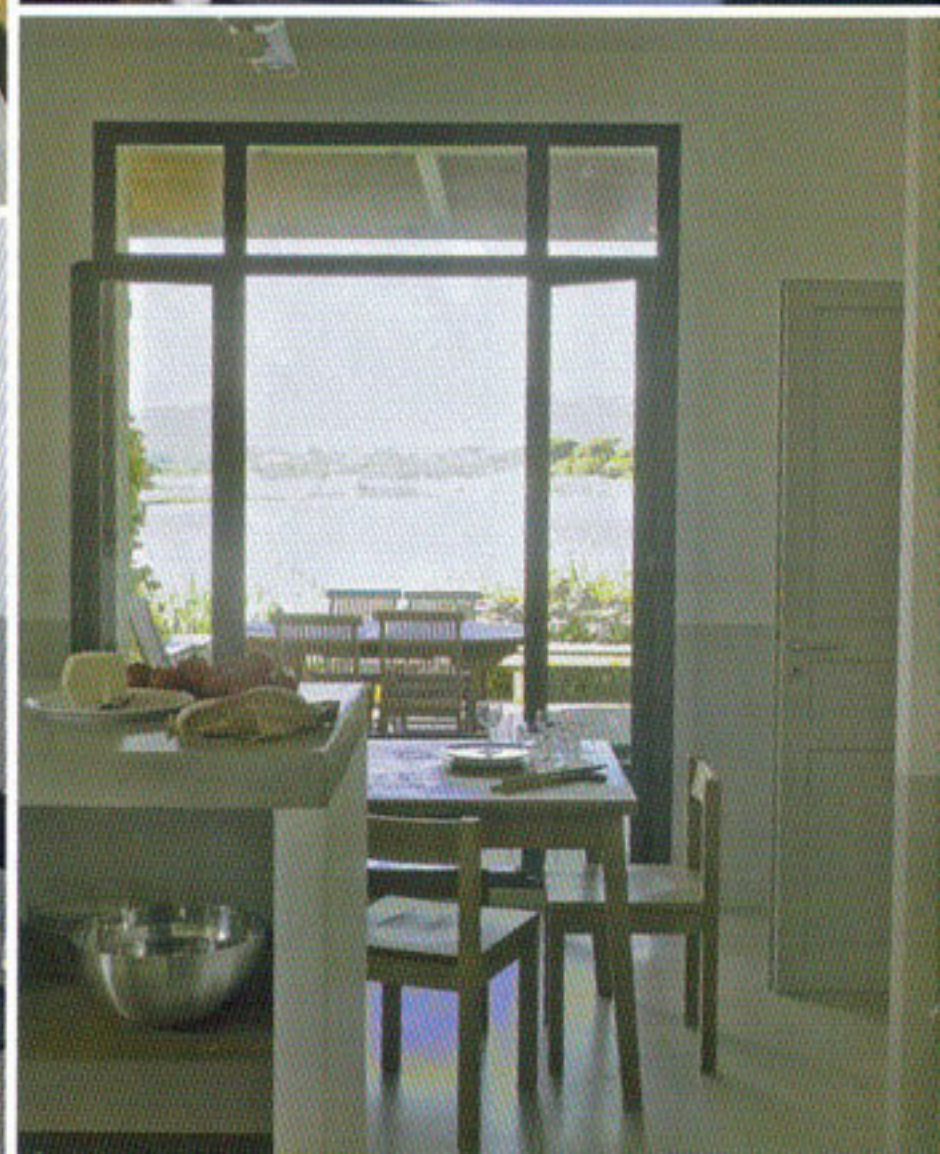
La Cuve, un exemple de réhabilitation au cœur de la ville, conduite par l'architecte Thomas Fourtané.

de mieux les intégrer au site.» Cette relation intime avec la nature est toujours conduite par une grande humilité architecturale. «En Corse, la nature est tellement généreuse qu'il faut la laisser prendre le dessus. Le choix des matériaux est essentiel. La pierre et le bois sont des matières caméléon prêtes à se fondre dans le paysage.» Ce lieu d'accueil est un bel exemple de reconversion dans la ville. Quai Syracuse, 20137 Porto-Vecchio, tél. : 04 95 25 10 21. Site: lacure.com De 600 € à 1500 € l'appartement de 4/5 personnes, selon saison.